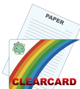
【仕上がりイメージ】